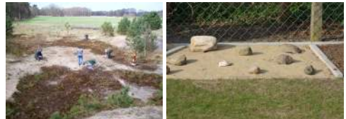
Rest-Binnendüne als natürlicher Lebensraum und Ersatzfläche im Garten