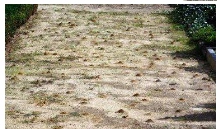
Massenvorkommen der Raufußigen Hosenbiene